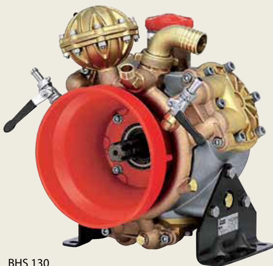
BHS 130 BHS 150